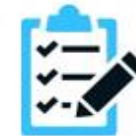
利用者名簿の作成

※「大声あり」は「観客等が通常よりも大きな声量で、反復・継続的に声を発すること」。